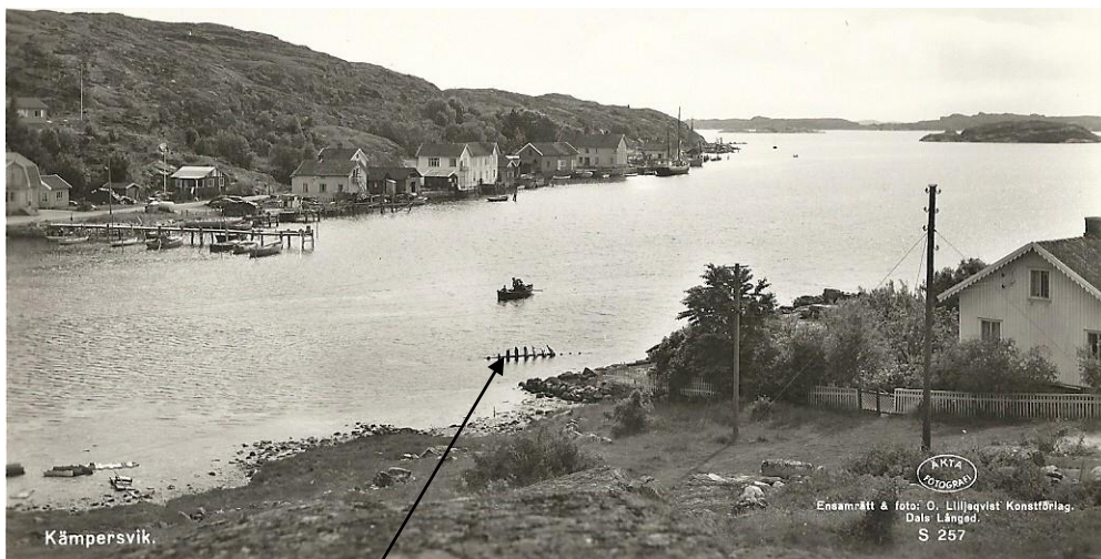
Vraket efter jakten Valborg ("Kämpa")