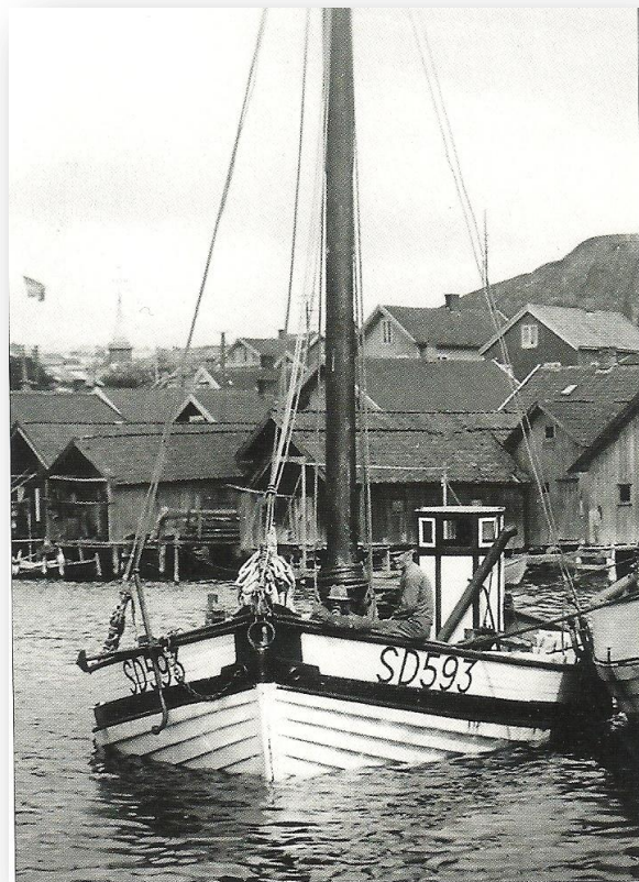
Jakten Valborg ligger till kaj i Bovallstrand för att invänta bättre väder.