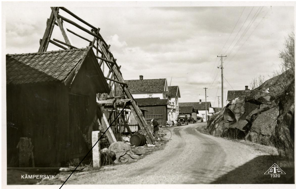
Vadbocken vid Kämperödspojkarna's brygga i Kämpersvik.