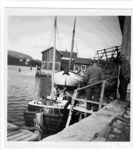
Jakten Valborg i hemmahamnen Kämpersvik. På fotot kan man se den stora vadbocken som stod på land vid "Kämpa`s" brygga .