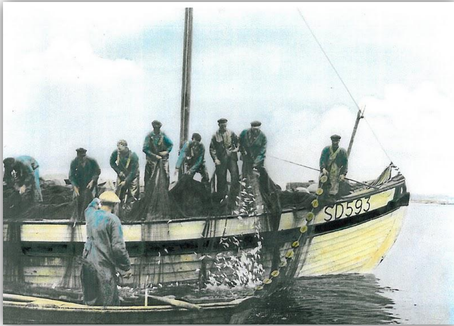
Vadlaget "Kämpa" drar in vaden efter ett lyckat kast efter skarpsill.