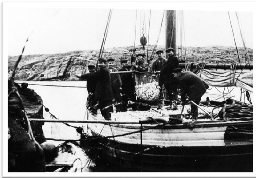
Vadlaget "Kämpa" på jakten Valborg (SD593) av Kämpersvik.