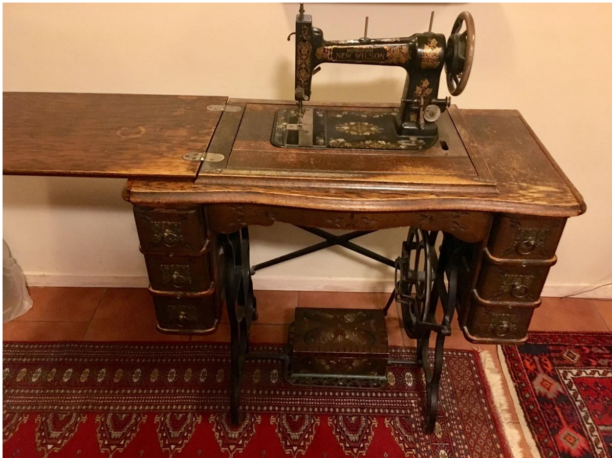
Symaskinen av märket "Improved New Wilson"