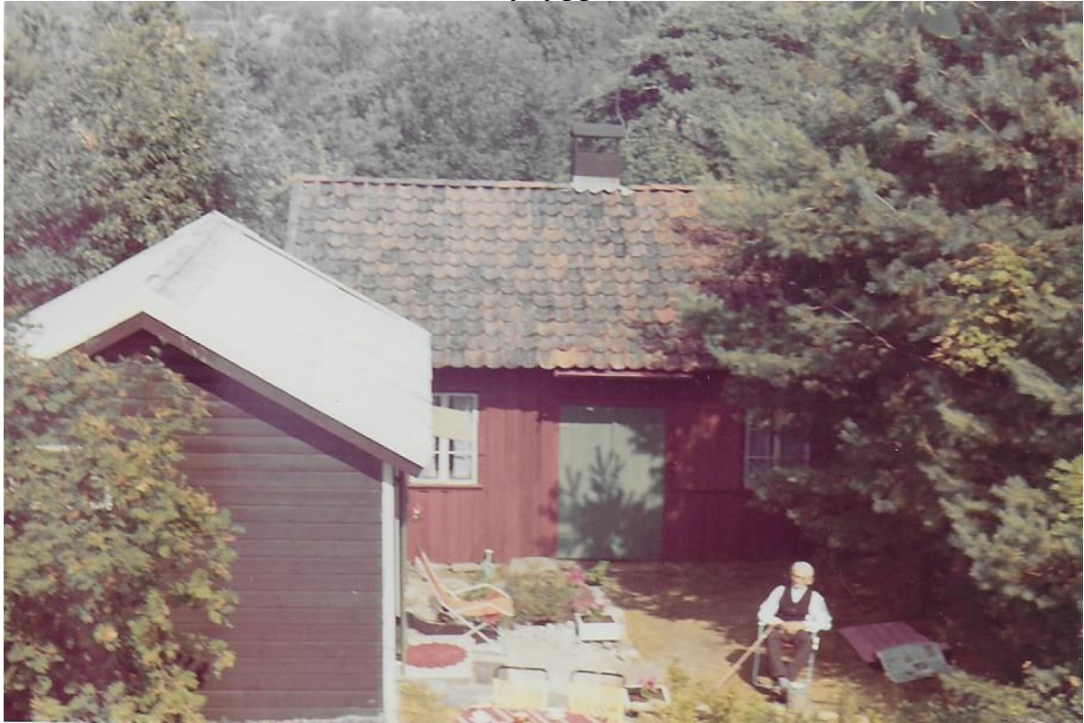
Lilla huset (matboden, kokhuset). Smeden utanför smedjan (Röda huset)

Förutom smedjan byggdes där också ett mindre hus som syns på bilden nedan. Detta mindre hus är nu en del i vårt nybygge.