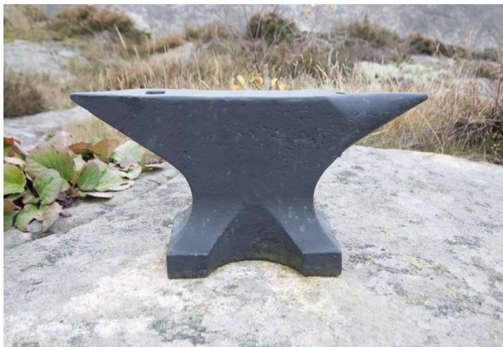
Detta städ är en av få saker som finns kvar efter smedjan.

Stenbrytning var ju en stor industri också i Kämpersvik. Eftersom stenbrytning skedde i berget mot Skredfors och det var många stenhuggare som behövde ha hjälp med att hålla verktygen i skick, så var det säkert lämpligt att ha en smedja i närheten av stenbrotten.