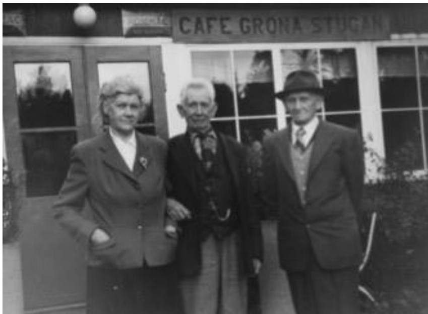
Smeden står till höger på bilden tillsammans med sin bror och hans fru.